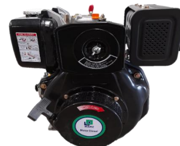
HL178 Powered by MARR