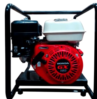
Motor KOHLER SH265 6.5HP