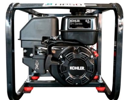
Motor KOHLER SH265 6.5HP