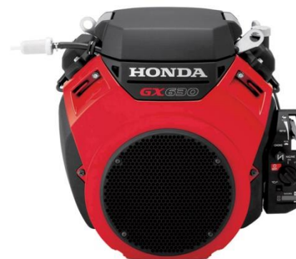
GX630 Powered by HONDA