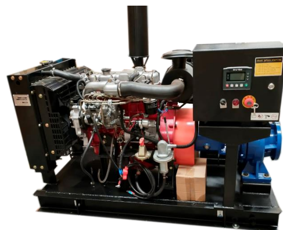
MBOMBA IS125 6"X4"