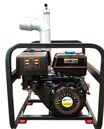
Motor MARR gasolina HL420