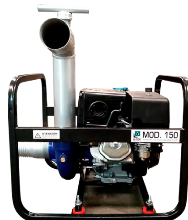
MOTOBOMBA MOD. 150

Ensamblada con motor MARR HL420 de 14 HP de 4 tiempos a gasolina.