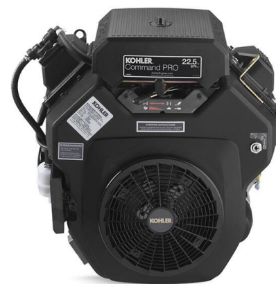
KOHLER CH680 23HP