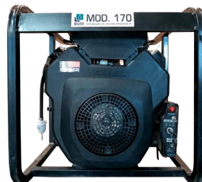
MOTOBOMBA 170 4"X3"

Ensamblada con motor KOHLER CH680 de 23 HP de 4 tiempos a gasolina