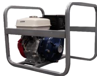
MOTOBOMBA 175 2"x2"

Ensamblada con motor Honda GX200 6.5hp, 4 tiempos a gasolina.