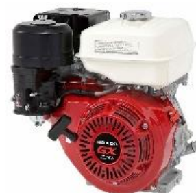
GX200 QX power by Honda