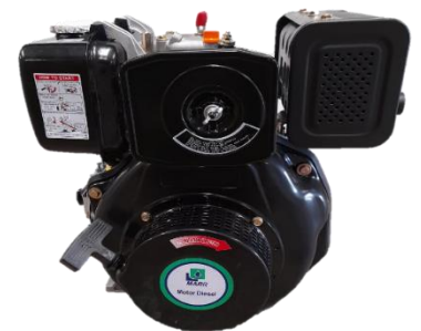
HL178FA power by Marr