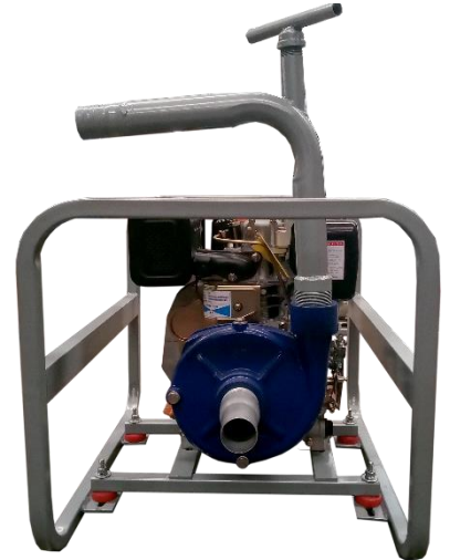
MOTOBOMBA 175 2"x2"

Ensamblada con motor Marr HL178FA 6.0 hp, 4 tiempos diésel.