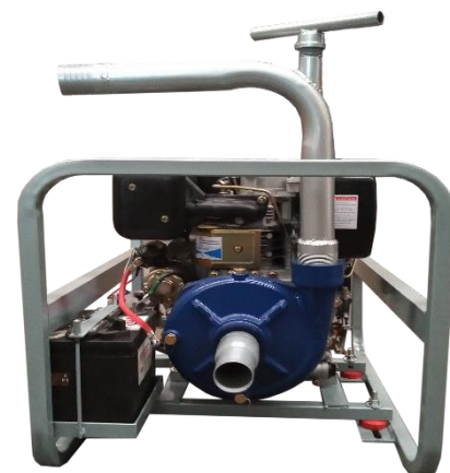
MOTOBOMBA 198 2"x2"

Ensamblada con motor Marr HL186FA 9hp, 4 tiempos a diésel.