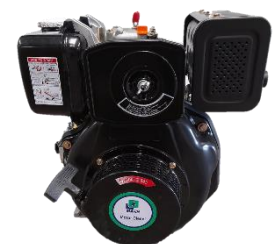
Motor MARR HL188 FVE