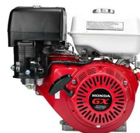
Motor HONDA GX270 9 HP