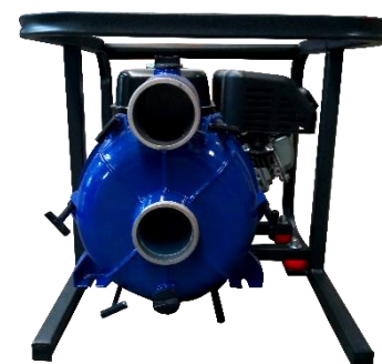
MODELO WB100 4"

Ensamblada con motor Honda GX270 de 9 HP.