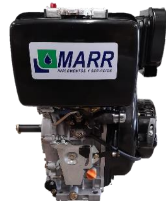
Motor MARR HL188 13HP