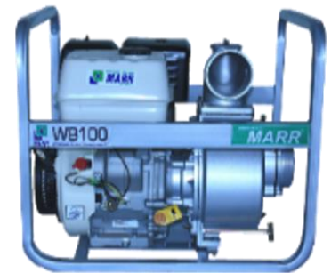
MODELO WB100 4"

Ensamblada con motor HL188 Powered by MARR de 4 tiempos diésel de 13 hp.