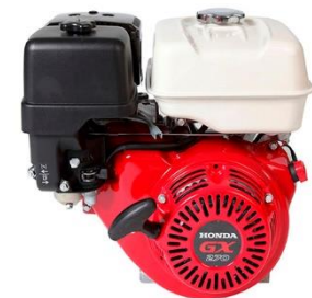
GX270 Powered by HONDA