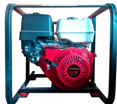
Motor HONDA GX270