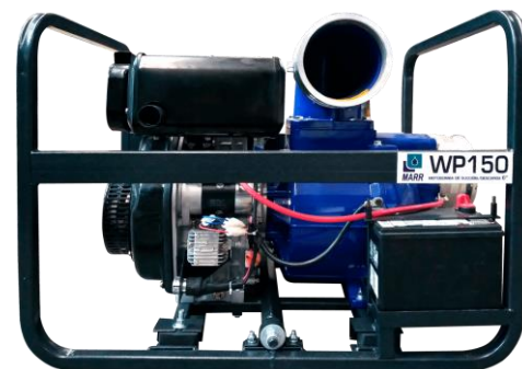
WP100 6" x 6"

Ensamblada con motor MARR HL188FVE 13HP de 4 tiempos en diésel.