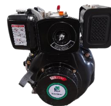
Motor MARR Diésel HL188FVE