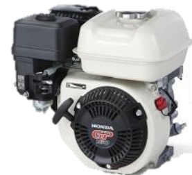
GP160 Powered by HONDA